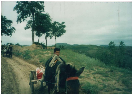
“真力量要从乡村中酝酿出来” ——梁漱溟

我们的生活是从脚下的土地开始的。父亲母亲温暖的呵护，放牛牧羊吟唱的歌谣，街巷小吃声声的叫卖，乡间小路朗朗的诵读，既构成了我们的生活，也成为了内心永远的铭记，都在这里发生。