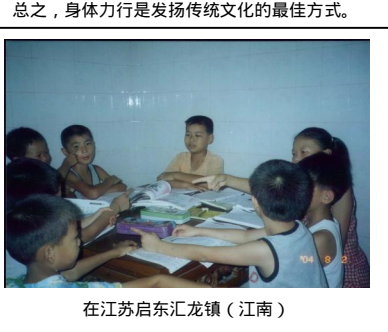
在江苏启东汇龙镇（江南）

化影响是很深的，生活的大环境就是人要中庸，要忠义礼智信，礼为重，而这些都是儿童很小时从父母的身教处得来，会影响他们的行为又将影响其他人及下一代。