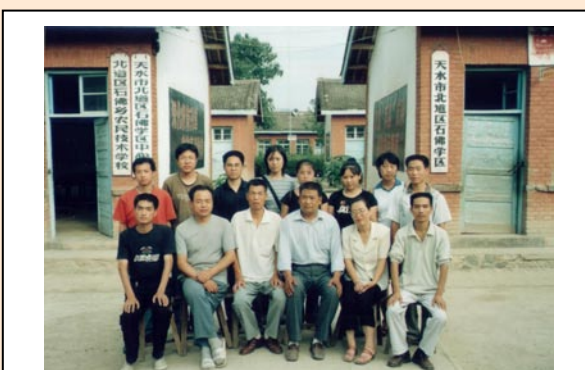
队员和石佛乡小学老师合影