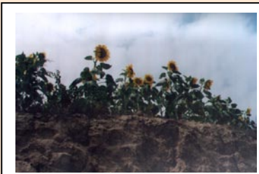
汪川乡的土地、花朵和天空

问：爸爸打过你吗，什么时候？ 伟峰：打过，语文写不好的时候。 问：爸爸妈妈能辅导你吗？ 伟峰：以前能，现在不行了。 问：爸爸妈妈对你的学习管得多吗？ 伟峰：爸爸少一些，妈妈多一些。 问：你愿意上学吗？ 伟峰：愿意。 问：爸爸妈妈关系好吗？ 伟峰：很好。 问：看电视吗？ 伟峰：看电视剧和动画片。 问：去过什么地方？