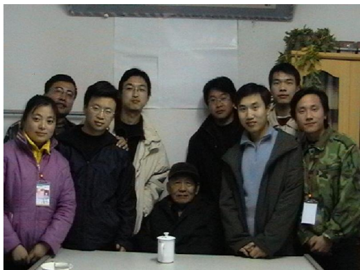
何兆武先生在一耽学堂讲座